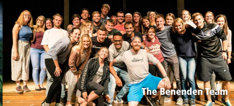
The Benenden Team