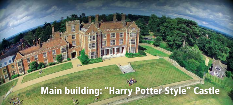
Main building: "Harry Potter Style" Castle